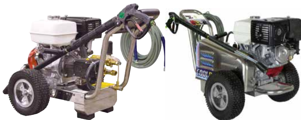
BENZ 280/15 SP95